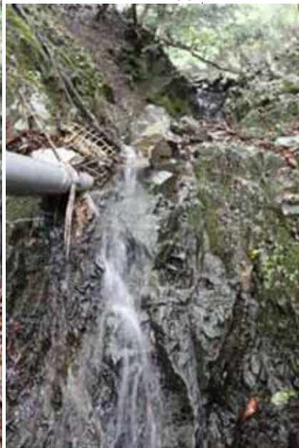
このパイプから、ドラム缶に水がためられホースで各小屋の水場へと行く