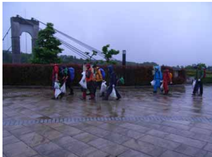
神奈川大学ワンダーフォーゲル部の皆さん