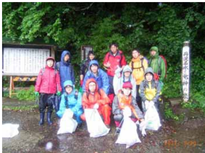
神大ワンダーフォーゲル部の皆さんと