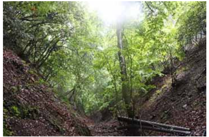
新緑の美しい一ノ沢