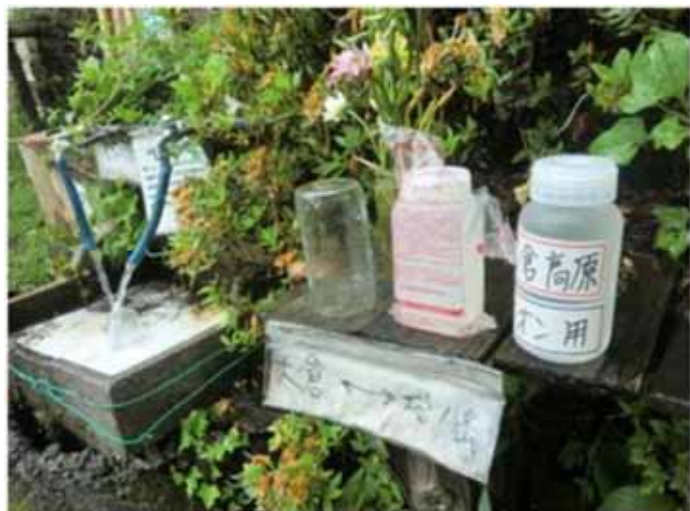
大倉高原山の家水場

重大事故が起きる前に、リーダーが山行中止の判断をできるよう改めるか、参加者を募る際に天候の条件をはっきり示していただきたい。