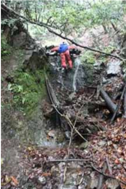
小さな沢だが、沢歩きが楽しめた