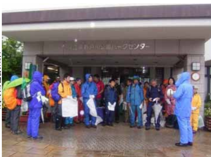
大倉本部開会式風景