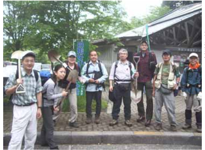
登山道整備に向かう皆さん