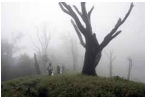
尾根の立ち枯れ・竜ヶ馬場付近

ものであった。まずは、丹沢を歩いて自然との一体感を感じることであろうか。人間としての努力は人間の痕跡を最小限にとどめることであろうか。気持ちよく歩くために出来ること。