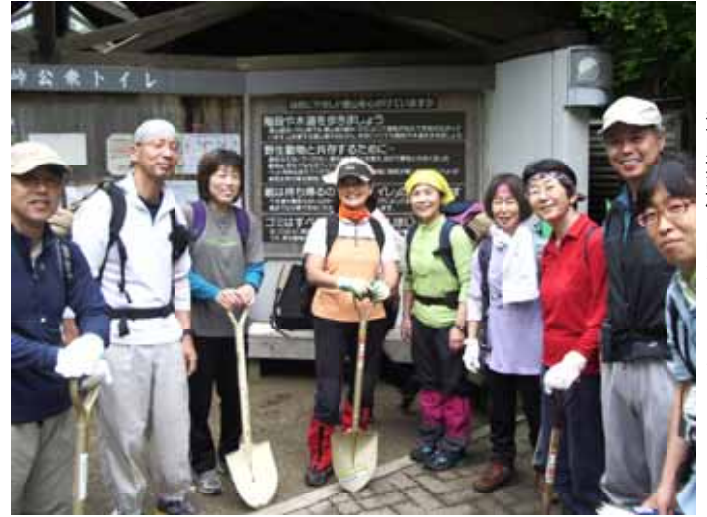
登山道整備に向かう皆さん