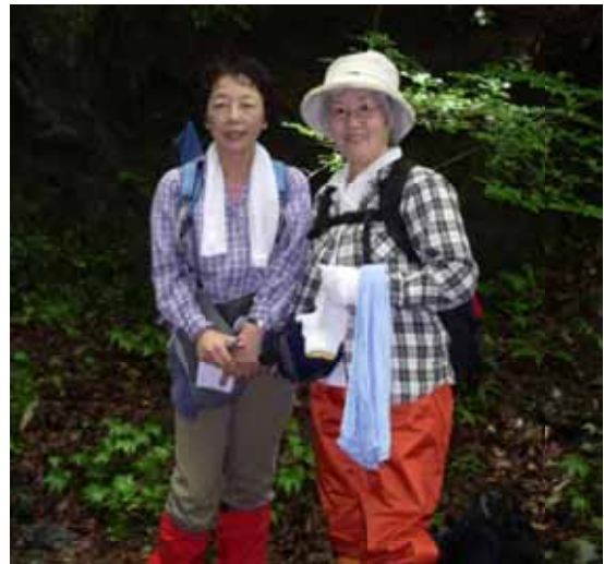
水質調査・後沢乗越チーム