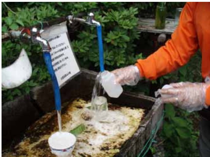
大倉高原山の家の水場

それに比較して大倉高原山の家の水場は、山の中の都会的な場所でした。20円水質維持管理費がかかる。今回は検査用サンプルの収集でしたので置いてはなかった。