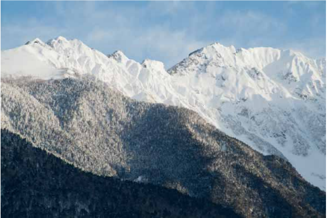
題名：『厳冬の奥穂高と西穂高』 場所：長野県上高地

2012年度ハイキングリーダー養成学校入校案内 3頁 「ファーストエイド講習会」2/12のご案内 5頁